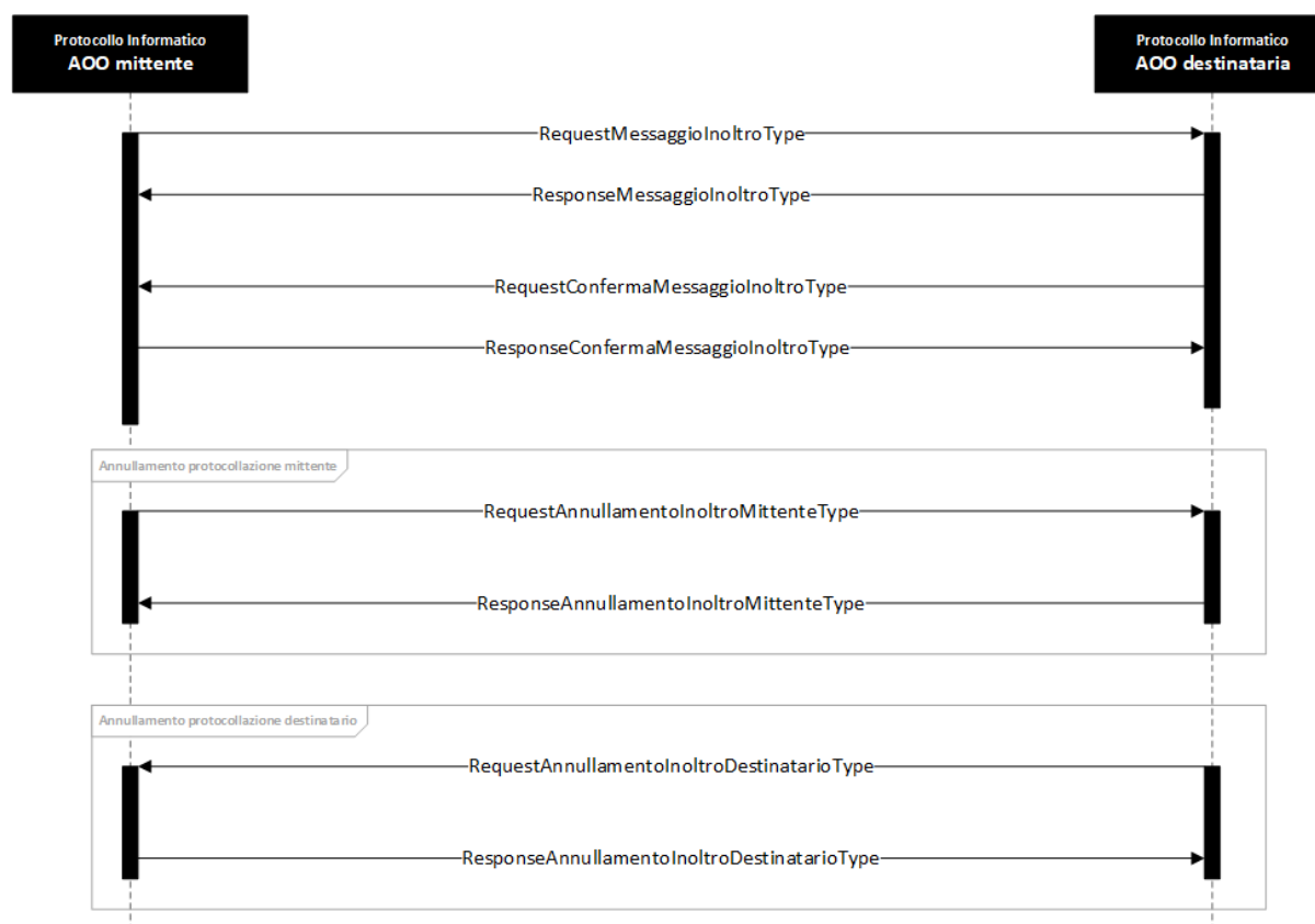
Figure 2. Comunicazioni tra AOO mittente e AOO destinatario

Le esigenze di comunicazione individuate sono sintetizzate nel seguente UML sequence diagram.